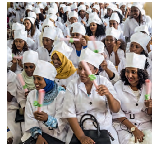
Abschlussfeier: Das Diplom ist für die armen Frauen eine Garantie für ein besseres Leben.

Die Frauen sind es, die das Notwendige tun. Viele Männer dagegen halten ihre Machtlosigkeit nicht aus: Hungerlöhne und Lebenshaltungskosten klaffen auseinander; ihre Familie nicht versorgen zu können, ist der grösste Angriff auf die männliche Identität. Manche Männer flüchten in billigen Schnaps oder zu einer neuen